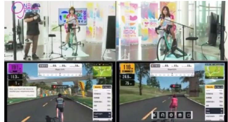
フジテレビ TOKYO IDOL FESTIVAL ONLINE2020