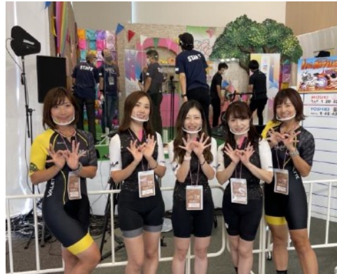
フジテレビ TOKYO IDOL FESTIVAL ONLINE2021